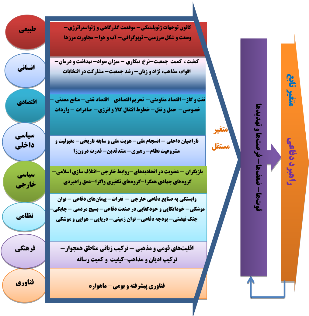
نمودار ۲. مدل مفهومی تحقیق

با توجه به سوالات، مبانی نظری و پیشینه‌های پژوهش، مدل مفهومی تحقیق به شکل ذیل (نمودار شماره ۲) ارائه می‌گردد: